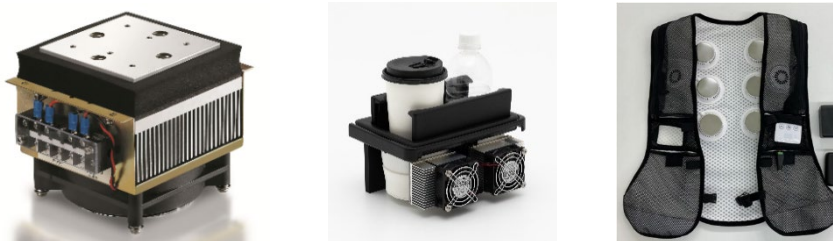
【左：サーモモジュール 標準アセンブリ品 / 中央・右：サーモモジュール応用製品】

製品紹介 URL: https://ft-mt.co.jp/product/electronic_device/thermo/